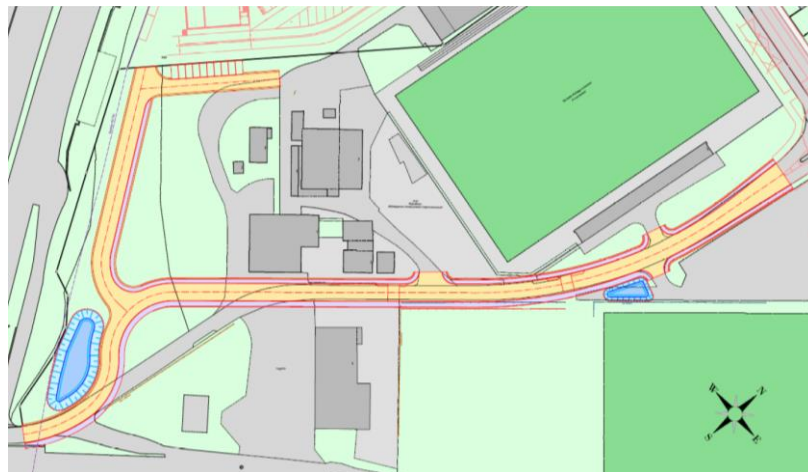
Geplanter Aus- und Neubau Flugplatzstrasse, welche die Zone für Sport- und Freizeitanlagen in zwei Teile zerschneidet