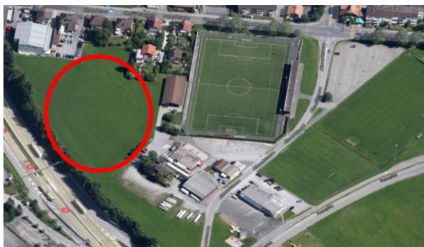
Geplanter Standort Abfallsammelhof und Recyclingcenter neben den Sport- und Freizeitanlagen Waldeck